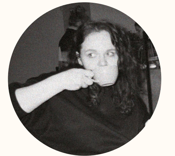
Иллюстратор — Даша Аи