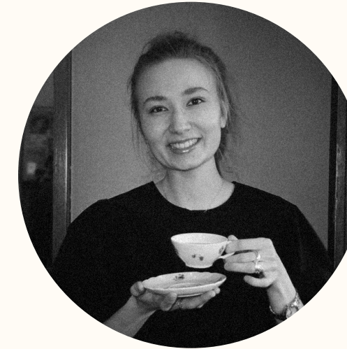
Главный редактор — Эрика Шакирова