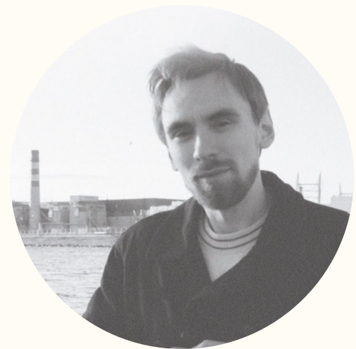
Автор статей, писатель, сценарист — Александр Югансон